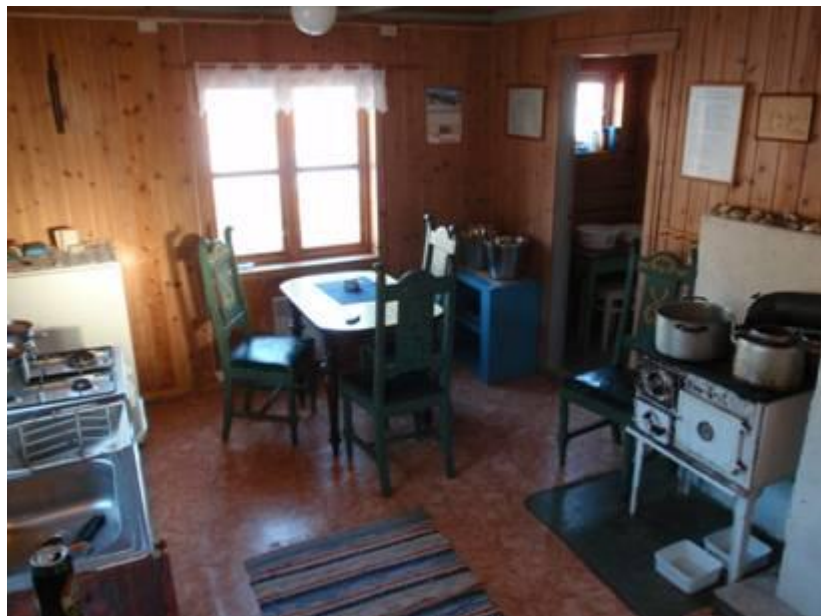
Kjøkkenen – fullt utstyrt