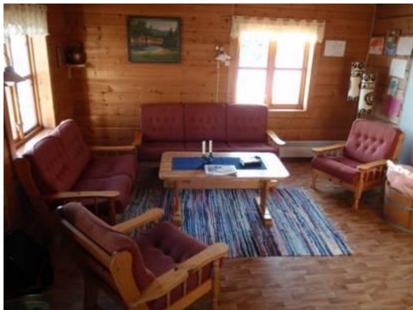
Stue med peisovn